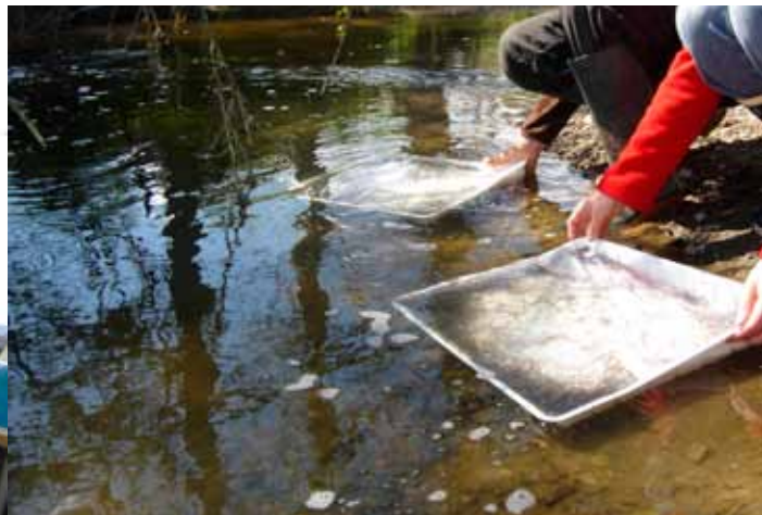
Marquage des civelles par balnéation et lâcher des civelles de repeuplement