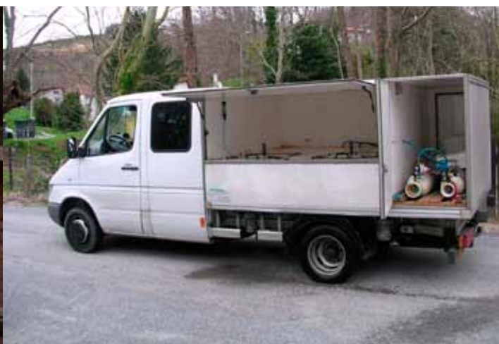
Caisses de transport et camion vivier muni d'un système d'oxygénation

Les alevins peuvent également être transportés par avion, dans le compartiment réservé aux animaux. Ils sont conditionnés de façon similaire, en caisses de polystyrène hermétiques (de 1 à 5 kg de poissons par caisse), à sec et au froid (2 à 8°C) afin de ralentir leur métabolisme et réduire leurs besoins en oxygène. Ces envois sont destinés au transport longue durée, jusqu'à 36 heures, et présentent des taux de survie des civelles supérieurs à 98 %. Les techniques utilisées sont désormais bien au point.