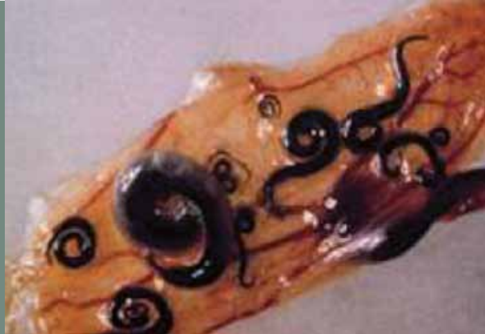
Parasite Anguillicola crassus 8