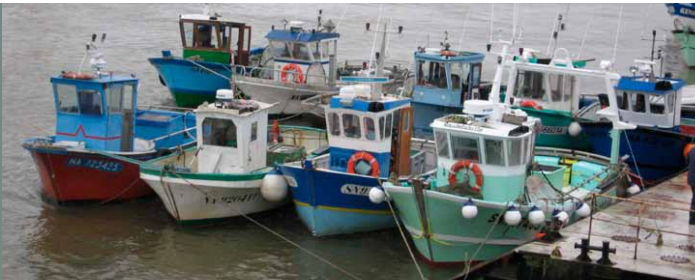
Civeliers à tamis circulaires