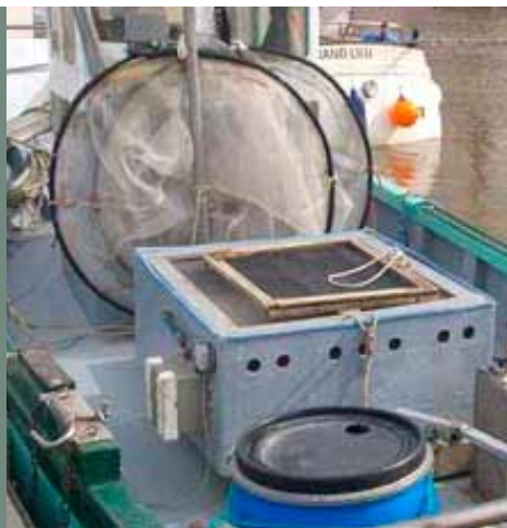
Vivier embarqué équipé d'un aérateur