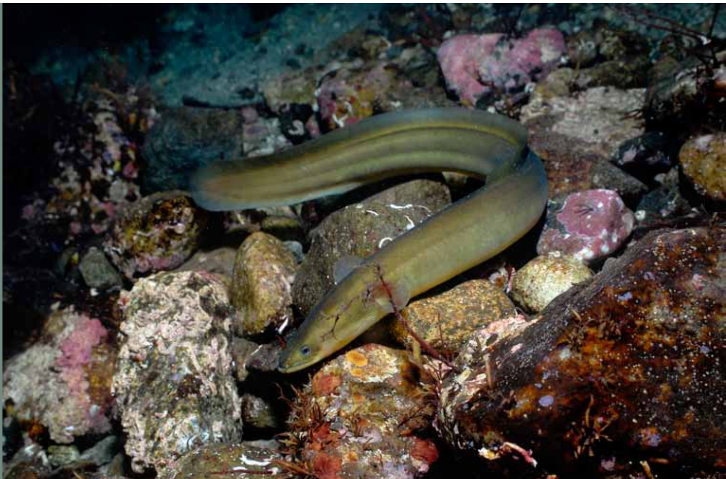
Anguille européenne, Hardanger, Norvège

Ces principes sont inscrits au sein du Code de conduite pour une pêche responsable de la FAO (1995) et constituent une référence pour la mise en oeuvre d'une filière de repeuplement ou de grossissement basée sur la capture de juvéniles dans le milieu naturel. Ils sont par ailleurs repris par le groupe technique du CIEM.