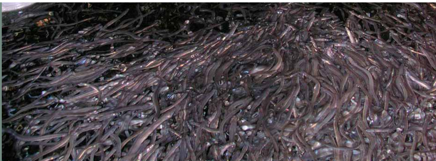
Civelles prégressées en phase d'alimentation