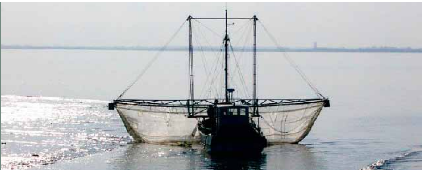
Civeler « pibalour » de l'estuaire de la Gironde

- Tamis carrés ou rectangulaires de surface d'ouverture inférieure ou égale à 7 m 2 , utilisés sur la Charente, la Seudre et dans l'estuaire de la Gironde. De configuration très variable selon le bassin prospecté, les filets ont une longueur totale de 7 à 10 mètres comprenant une chaussette de 5 à 7 mètres de long, et se composent de 4 maillages différents compris entre 2000 et 1000 µm. Si certains navires pêchent en poste fixe (tamis carrés surtout) et piègent les civelles grâce à la seule force des courants, d'autres travaillent en surface à des vitesses comprises entre 0,5 et 2 noeuds (estuaire de la Gironde principalement). Dans ces conditions, ces civeliers appelés « pibalours » produisent des alevins de très bonne qualité.