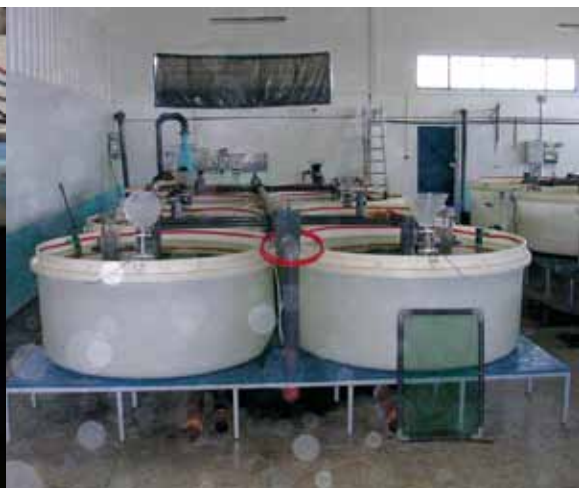
Circuit d'élevage de civelles

A ce stade biologique et selon les quantités disponibles, les civelles peuvent être maintenues en bassins de stabulation sans contrainte particulière, entre 2 et 6 jours avant d'être expédiées. Afin de ralentir la vitesse de pigmentation et la perte de poids des alevins, tout en maintenant leur vitalité et leur comportement de nage en pleine eau, l'eau des bassins peut être refroidie. Les civelles peuvent ainsi être maintenues en vivier entre 1 et 3 semaines dans une eau de température inférieure à 10°C. Cette procédure peut s'avérer nécessaire en début ou en fin de saison de pêche, ou chaque fois que les températures viennent à dépasser les 10°C.